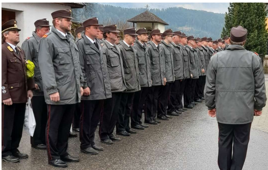
Florianimesse in der Spitalskirche