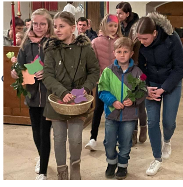
Muttertagsmesse in St. Anna