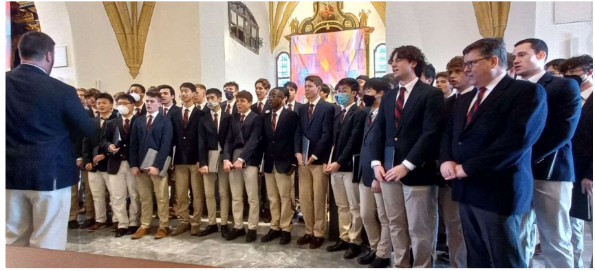
Roxbury Latin Clew Club zu Gast in Obdach