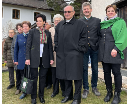
Bischof Krautwaschl in St. Anna