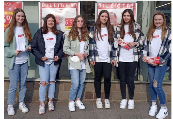
Ukrainehilfe der Firmlinge