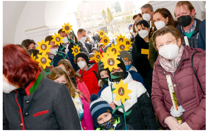
Tauferneuerungsgottesdienst der Erstkommunikationskinder zum Thema Sonnenblume